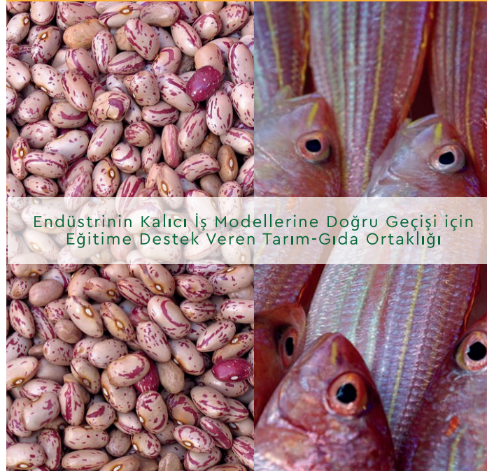
Endüstrinin Kalıcı İş Modellerine Doğru Geçişi için Eğitime Destek Veren Tarım-Gıda Ortaklığı

Proje, iki temel hedef gruba hitap eden ilgili Mesleki Eğitim ve Öğretim (VET) becerilerinin sağlanmasına odaklanacaktır: KOBİ'lerini uzun vadeli sürdürülebilir uygulamalara doğru geliştirmek, sosyal, çevresel ve ekonomik faktörlere entegre etmek için becerilerini yenilemek ve beceri kazanmak isteyen deneyimli tarım - gıda girişimcileri için sürekli eğitim (CVET). Özellikle düşük vasıflı gençler veya işsizler olmak üzere gençlere yönelik, onlara tarım - gıda sektöründe iş yönetimi ve iş modellerinde bir kariyer fırsatı olarak, yeni bilgi, beceri ve yetkinlik kazandıracak olan I-VET ve / veya C-VET. Bu grup, ilk grup tarafından kullanılacak resmi olmayan üst düzey dijital yeterliliklere sahiptir.